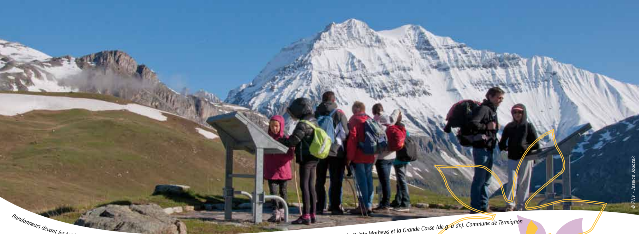
Randonneurs devant les tables de lecture de Plan du Lac. Vue sur la Roche de la Queua, la Pointe de la Grande Glière, la Pointe de la Petite Glière, la Pointe Mathews et la Grande Casse (de g. à dr.). Commune de Termignon.