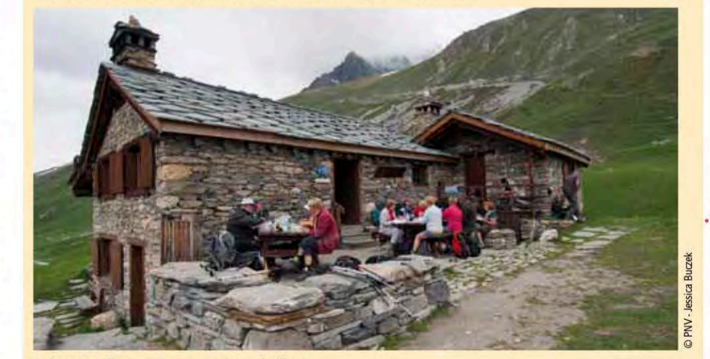
Refuge de Vallonbrun. Commune de Lanslevillard.