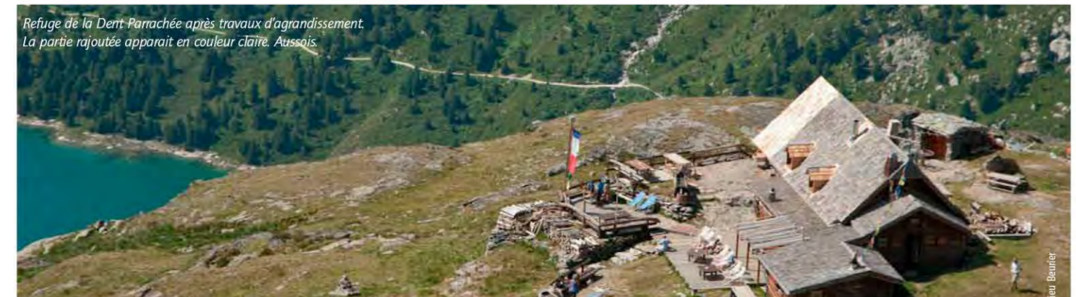
Refuge de la Dent Parrachée après travaux d'agrandissement. La partie rajoutée apparaît en couleur claire. Aussois.