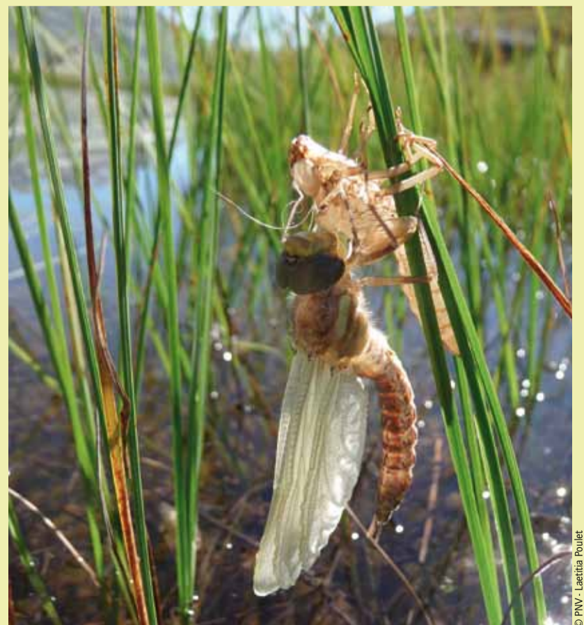
Phase d'émergence de l'aeschne des joncs.