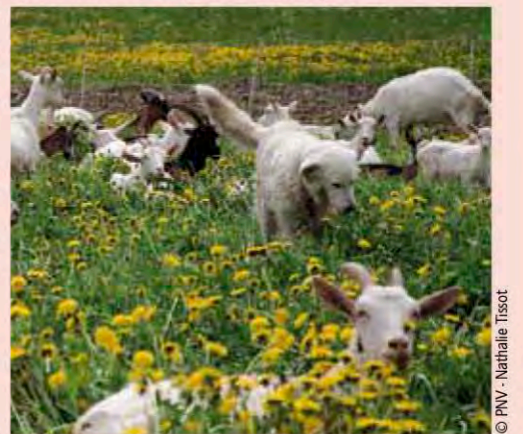
Troupeau de chèvres et jeune patou dans un prairie envahie de pissenlits en fleurs.

Merci de respecter la quiétude du troupeau et le travail du berger.