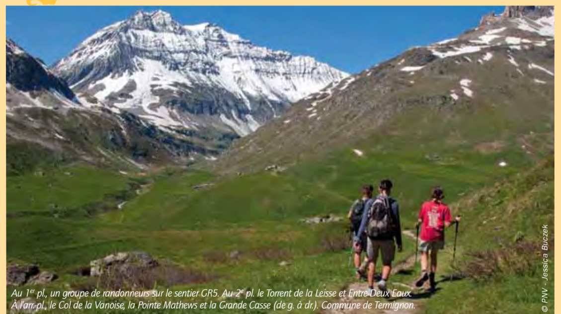
Au 1 er pl., un groupe de randonneurs sur le sentier GR5. Au 2 e pl. le Torrent de la Leisse et Entre-Deux-Eaux. À l'arr.-pl., le Col de la Vanoise, la Pointe Mathews et la Grande Casse (de g. à dr.). Commune de Termignon.