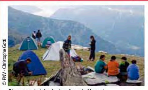
Bivouac autorisé près du refuge de l'Arpont.

Dans le cœur du Parc, les chiens sont interdits à l'exception des chiens de berger pour la garde des troupeaux et des chiens assistant des personnes handicapées. Pourquoi ? Parce que même petit, gentil et bien dressé, le moindre chien présente des risques au sein d'un espace naturel : paniques parmi les troupeaux, transmission de germes nuisibles pour d'autres mammifères, destruction des couvées d'oiseaux nichant au sol.