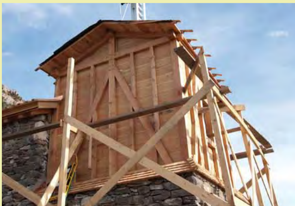
Restauration du télégraphe Chappe situé au Mollard Fleury. Commune de Sollières-Sardières.